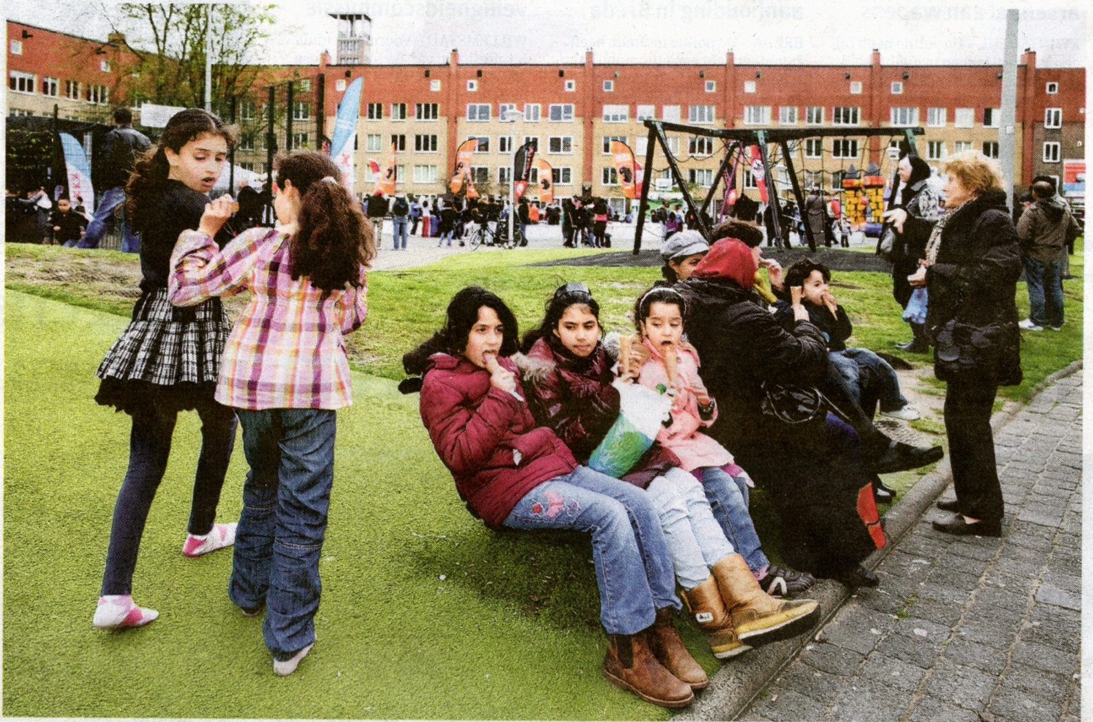
De hele buurt viert Bevrijdingsdag op het Makassarplein in de Indische Buurt: 'Wij zijn De Pijn van de toekomst'